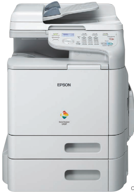
O modelo apresentado é o CX37DTNF

A série Epson AcuLaser CX37DN permite, aos grupos de trabalho de média a grande dimensão, a impressão A4 duplex e ainda cópia e digitalização a cores e a preto, com fax disponível nos modelos CX37DNF e CX37DTNF. A série também inclui um alimentador automático de documentos de origem, ao passo que um tabuleiro de papel adicional opcional permite que os grupos de trabalho incrementem ainda mais a produtividade e poupem tempo ao aumentar a capacidade de papel, rápida e facilmente.