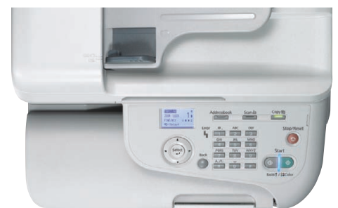
Controlos nítidos e acessíveis tornam a série AcuLaser CX37DN fácil de usar